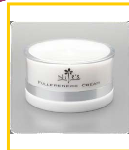
フラーレンクリーム ($95)